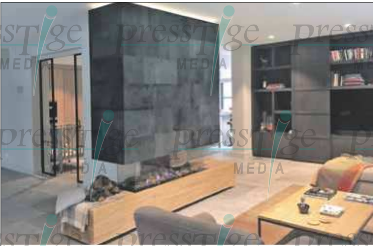
DIVERSE HAARDEN ALS SHOWROOMMODEL TE LEVEREN

KAPELLERLAAN 241 ROERMOND - THIJSSSEN-OPTIEK.NL